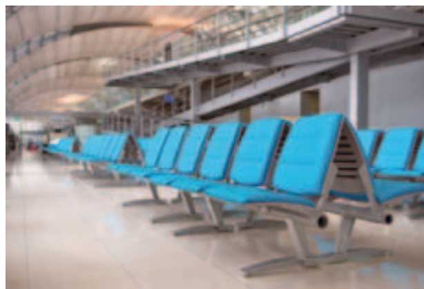
Keine Wartezeit. In den Tarifen 814, 835 und 820 K gibt es Leistungen ab dem ersten Tag.

Bayern nicht sofort zu bezahlen, sondern die Rechnung umgehend an sie weiterzuleiten. Erst nach Prüfung der Rechnung, das dauert in aller Regel höchstens 10 Tage, sollten Versicherte bezahlen. Zweibett-Zimmer wird, wenn Sie Ihre Beihilfe-Karte abgeben, ohnehin direkt abgerechnet.