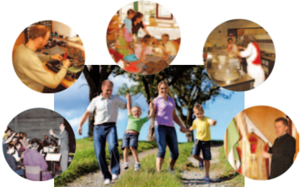
Fürsorge- und Sozialleistungen gehören zum Profil kirchlichen Tarifrechts: Mitarbeiter sind in der Kirche mehr als Arbeitskräfte.

Bei gleicher Rechnung und gleichem beihilfefähigem Betrag erhält trotzdem