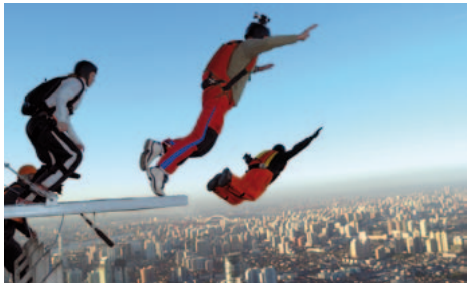
Weltweit abgesichert. Selbst beim Hochhaus-Fallschirmspringen in Shanghai.

Für Brillen und Kontaktlinsen werden innerhalb von drei Jahren 155 Euro im