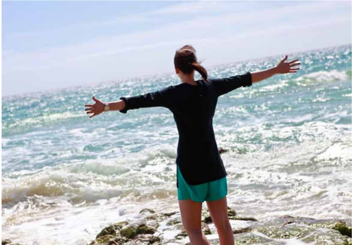
Beschäftigte bei der Kirche – Freude über mehr Geld und mehr Urlaub.

Gegenstand der Tarifverhandlungen war auch die Regelung des Urlaubsanspruchs. In der Vergangenheit gab es immer wieder Diskussionen zur möglichen Altersdiskriminierung im Zusammenhang mit dem Urlaubsanspruch der Beschäftigten. Ab 2014 hat nun jede Beschäftigte beziehungsweise jeder Beschäftigte, ausgehend von einer Fünftageweche, einen Urlaubsanspruch von 30 Tagen im Kalenderjahr.