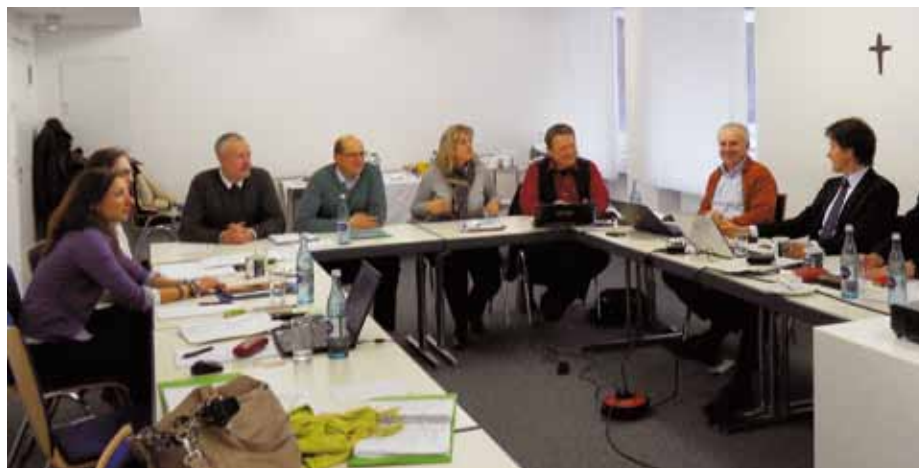
Hartes Ringen für Religionslehrkräfte – Arbeitsgruppe tagte in Nürnberg.