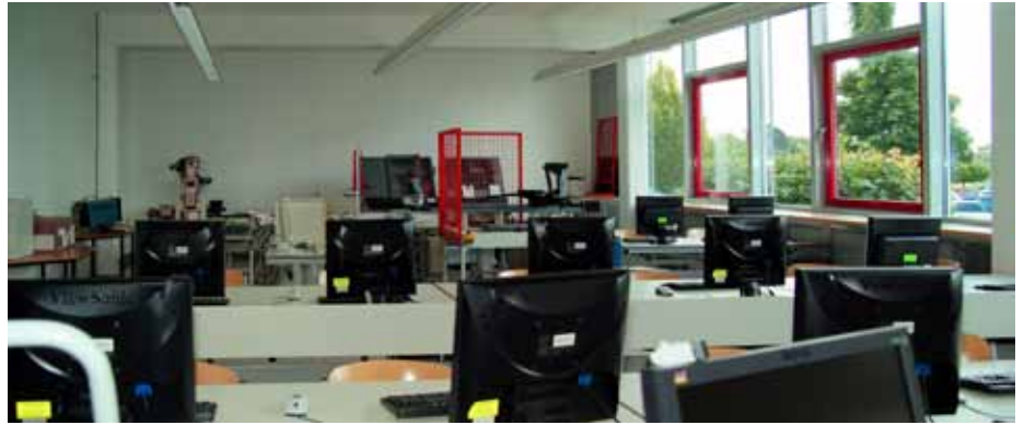
Vielseitiger Einsatz von Computern in der Schule – eine umfassende Aufgabe für Systembetreuer.

„Die zentralen Aufgaben der Systembetreuerin beziehungsweise des Systembetreuers liegen im pädagogischen Bereich.“ Dahinter verbergen sich Tätigkeiten wie die Organisation, Durchführung und Leitung einschlägiger Fachsitzungen, die Klärung und Besprechung didaktischer Fragen zum Einsatz der Neuen Medien, die Information über wesentliche fachliche und didaktisch-methodische Veröffentlichungen, Schulinterne Lehrerfortbildungen im Bereich der Neuen Medien sowie die Beratung und Unterstützung des Kollegiums. Organisatorische und koordinierende Aufgaben kommen hinzu. Dazu zählt die Beratung und Planung bei der Beschaffung von Software, die Organisation des Zugangs zu Hard- und Software und die Beratung und Hilfestellung beim EDV-Einsatz in der Schulverwaltung und Betreuung der entsprechenden Programme. Das Ministerium verweist zudem darauf, dass nur in vertretbarem Maße technische Aufgaben wie die Installation von Software und die Behebung von Hardware-Problemen zu übernehmen