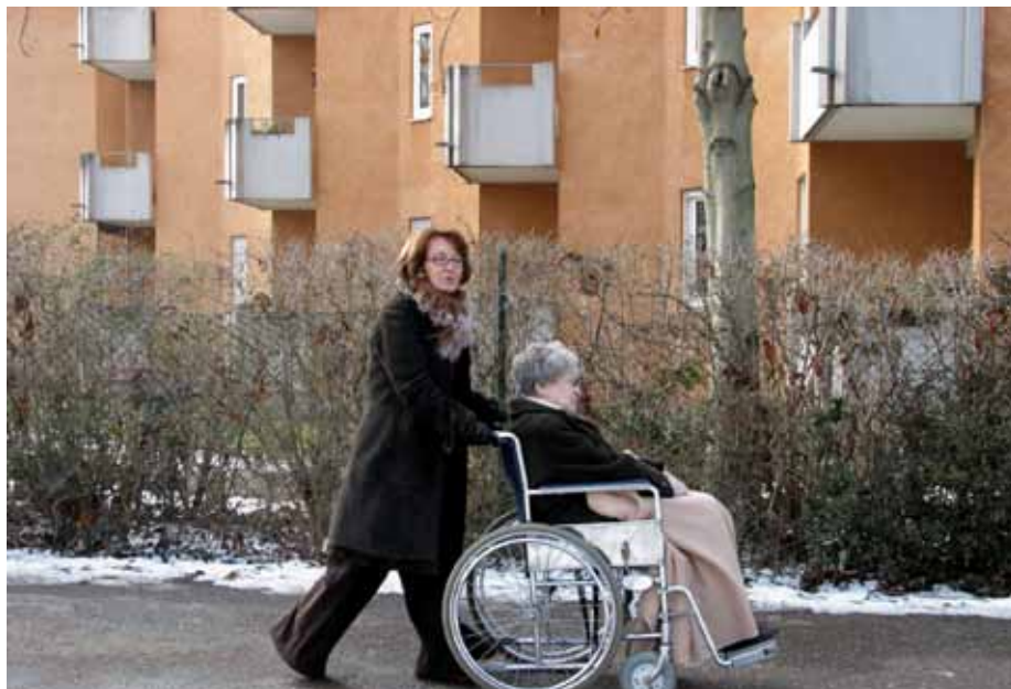
Helpende Hände gesucht – Pflege von Angehörigen belastet Beschäftigte.

Dazu dient insbesondere die kurzfristige