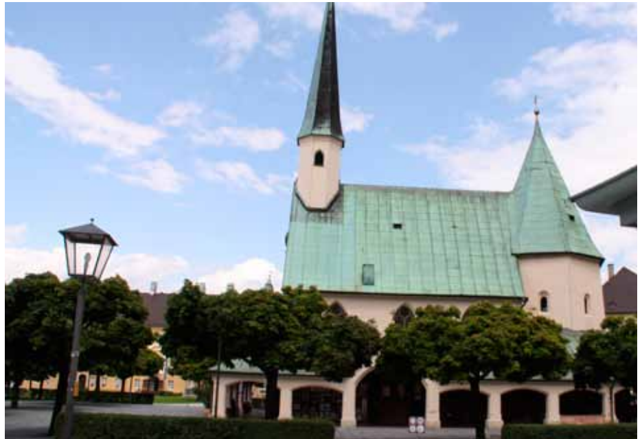
Auf nach Altötting – Künftig Arbeitsbefreiung auch für Wallfahrten.